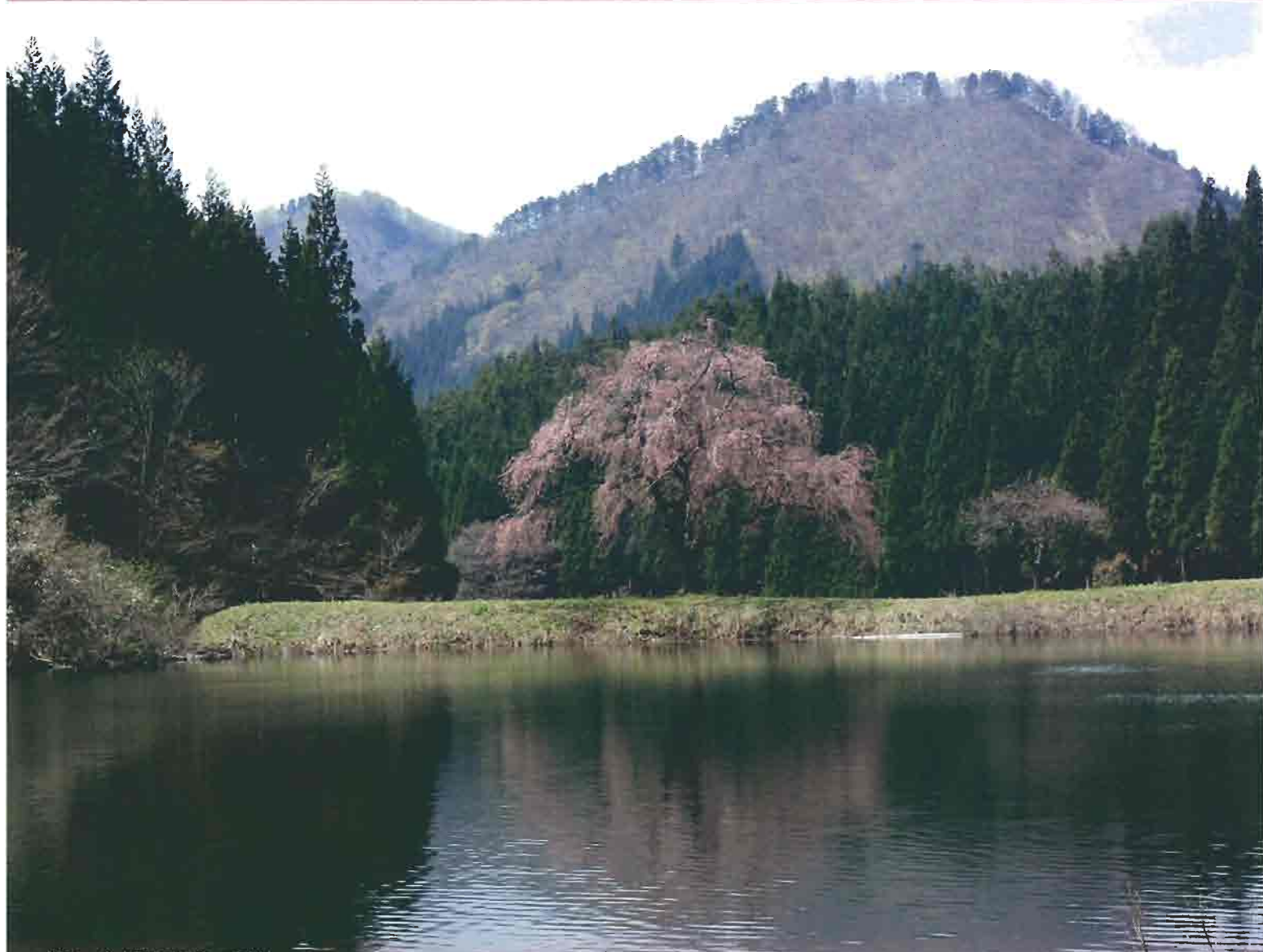
写真：金山町「田屋の一本桜」