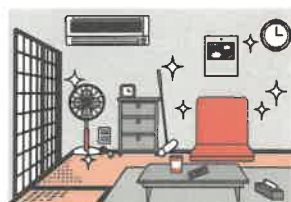
③火災の拡大を防ぐために、部屋を整理整頓し、寝具、衣類及びカーテンは、防災品を使用する