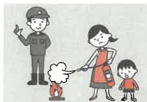
⑥防火防災訓練への参加、戸別訪問などにより、地域ぐるみの防火対策を行う