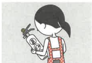
④火災を小さいうちに消すために、消火器等を設置し、使い方を確認しておく