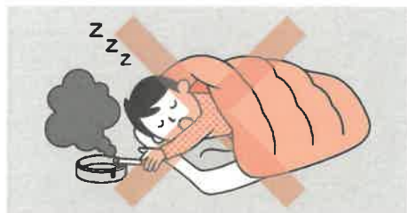
①寝たばこは絶対にしない、させない