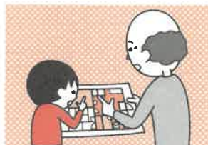
⑤お年寄りや身体の不自由な人は、避難経路と避難方法を常に確保し、備えておく