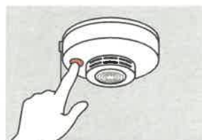
②火災の早期発見のために、住宅用火災警報器を定期的に点検し、10年を目安に交換する