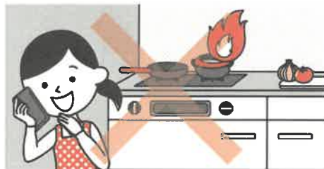
③こんろを使うときは火のそばを離れない