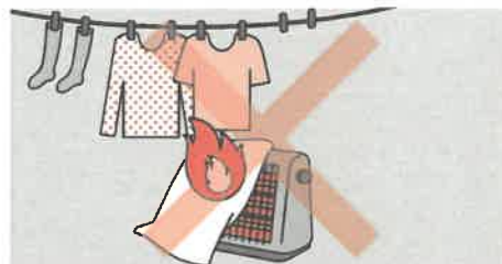
②ストーブの周りに燃えやすいものを置かない